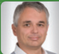
Mag. Dr. Egger Wirtschaftsprüfer & Steuerberater NÖWP