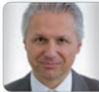
Prof. (FH) WP/ StB Dr. Egger Wirtschaftsprüfer und Steuer- berater NÖWP