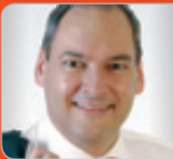
Mag. Macho Verrechnungs- preis-Experte Großbetriebs- prüfung