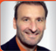
HR Steiner Verrechnungs- preis-Experte Großbetriebs- prüfung