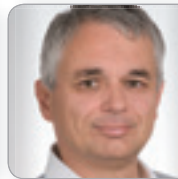
Mag. Dr. Egger Wirtschaftsprüfer & Steuerberater NÖWP