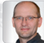
Mag. Feckter Finanz- verwaltung Großbetriebs- prüfung Linz