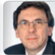
RR ADIr. Hofbauer Lohnsteuer- Experte ehem. BMF