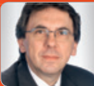
RR ADiR. Hofbauer Lohnsteuer- Experte ehem. BMF