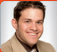
MMag. Dr. Ecker UST-Experte BM für Finanzen