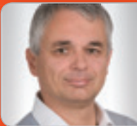
Mag. Dr. Egger Wirtschaftsprüfer & Steuerberater NÖWP