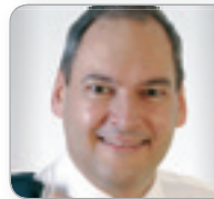
Mag. Macho Verrechnungs- preis-Experte Großbetriebs- prüfung