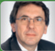
RR ADir. Hofbauer Lohnsteuer- Experte ehem. BMF